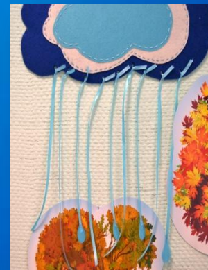
Зона развития речевого дыхания