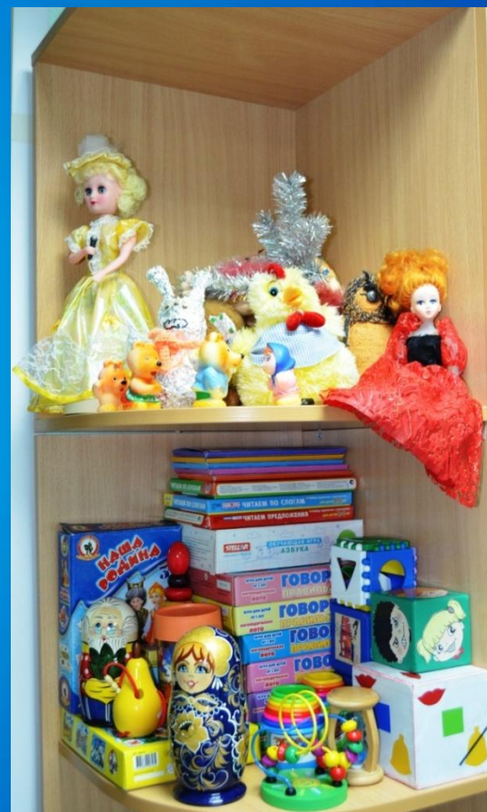
Зона дидактического обеспечения