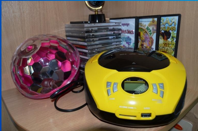
Зона технического сопровождения