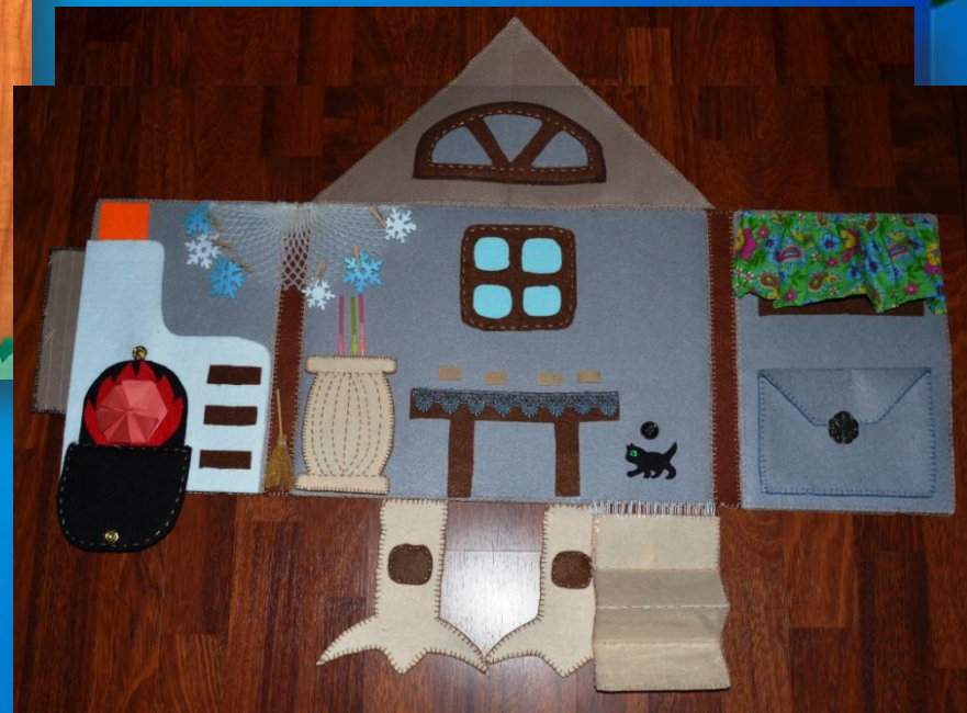
«Избушка Бабы Яги»