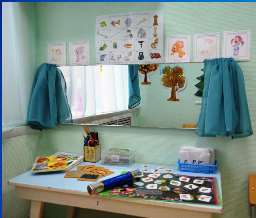
Зона коррекции произношения